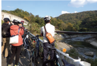
亀の瀬インフラツーリズム社会実験の様子