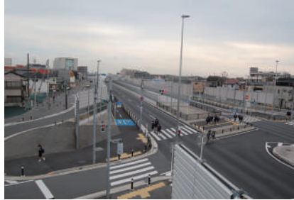
国道298号外環(千葉県区間)

管理技術者:小池 幸夫 優秀技術者:小池 幸夫 テクリス番号:4044601961