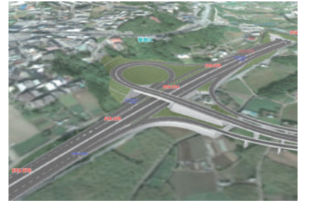
幸地インターチェンジ施工計画検討