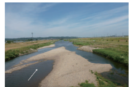
川の自然再生(阿賀野川の支川 早出川)