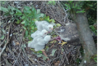
成鳥メスによる給餌の様子