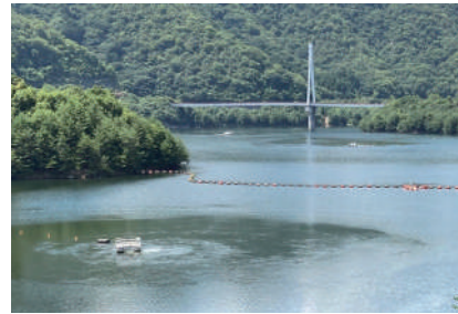
八田原ダム貯水池とアオコ対策の曝気循環装置稼働状況