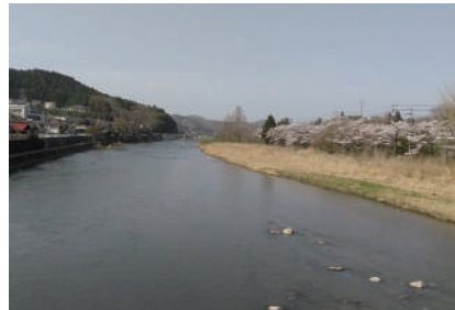
大子町を流れる久慈川と桜並木の様子