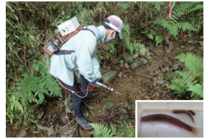
魚類調査の実施状況(右下はナガラホトケドジョウ)