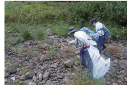
発注者と協働で外来種駆除へ取組みの様子