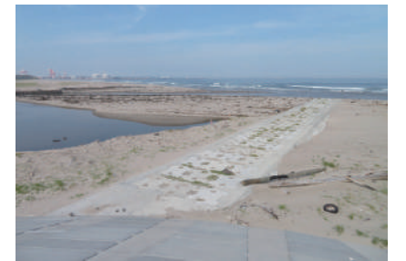
海岸堤防と七北田川河口部