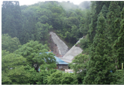
工事中の水上沢砂防堰堤