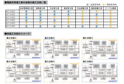
様々な施工分担の代表例