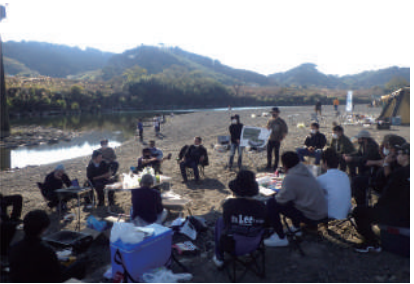
社会実験における地域・町・国との意見交換の様子