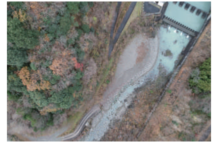
下久保ダム直下に設置された置土(R3.12月撮影)