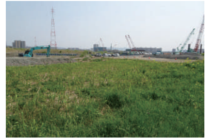
工事中モニタリングの調査地