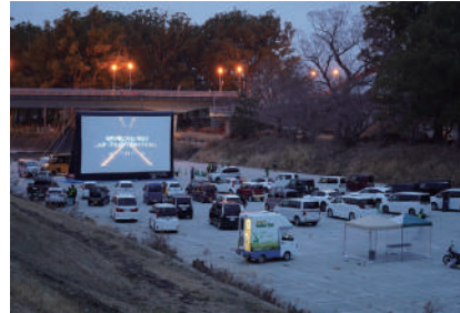
船小屋ドライブシアター