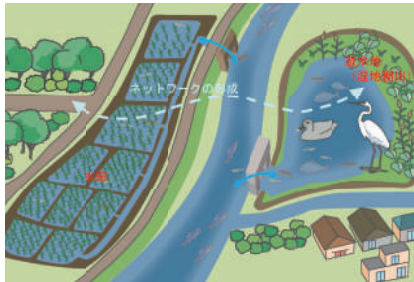
整備計画における環境配慮事項の検討